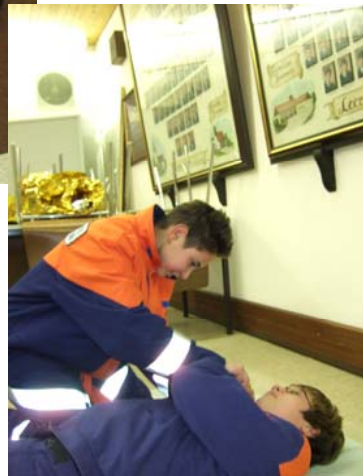
auch Hidi macht das schon ganz gut.

Bilder und Berichte von Markus und Christian