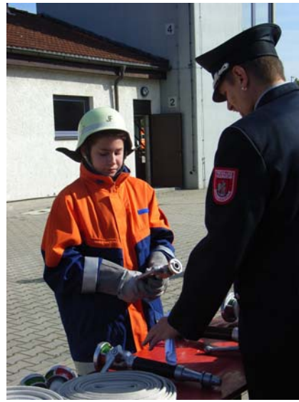
Hidi muss die Durchflussmengen der verschiedenen Strahlrohre aufzählen