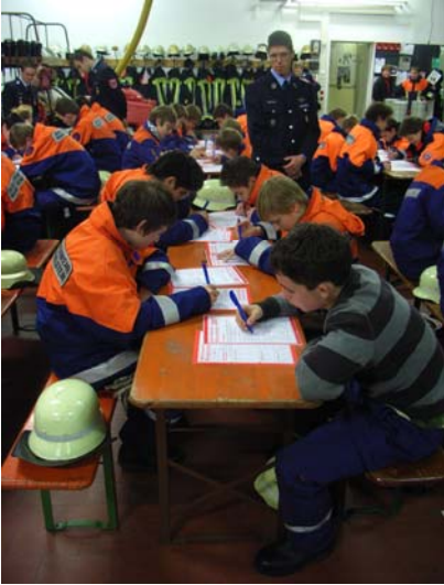
Zuerst musste der schriftliche Teil abgelegt werden...