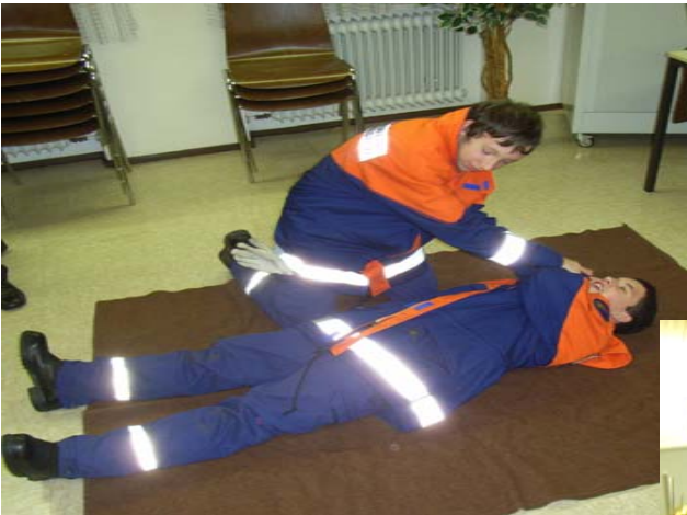
Der Patient muss in die stabile Seitenlage gebracht werden