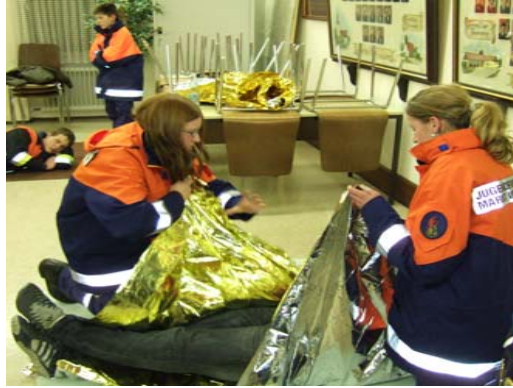
Im 2. Teil war Praxis gefragt. Hier wickeln die Mädels den Patienten fachgerecht in eine Rettungsdecke, damit er nicht auskühlt.